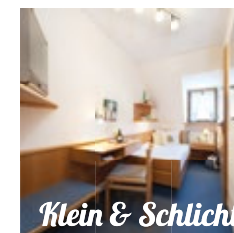
Klein & Schlicht