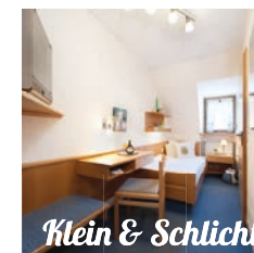
Klein & Schlicht