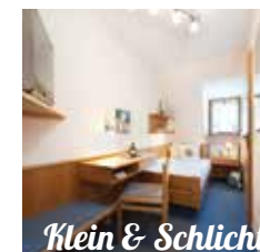
Klein & Schlicht